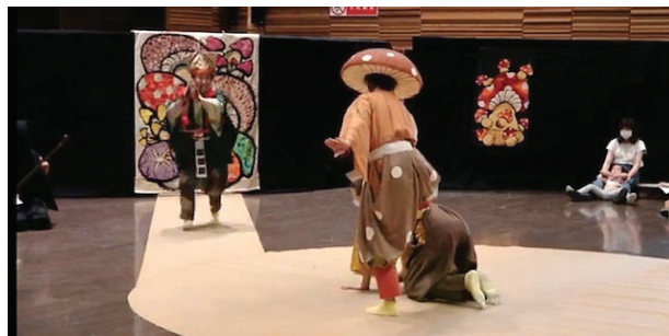
(図3) 「くさびら」上演の様子