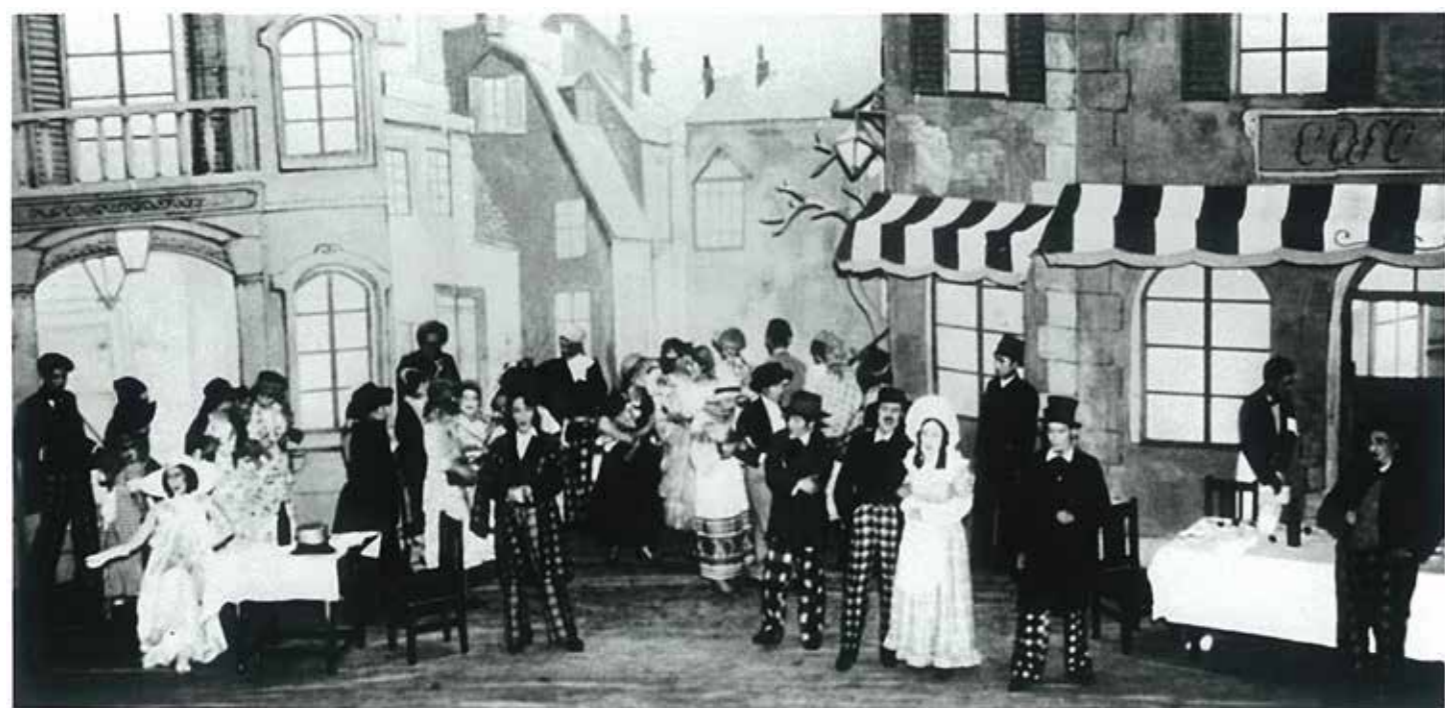
藤原歌劇団旗揚げ公演「ラ・ボエーム」(1934年)

また、1986年には日本で初めて字幕を導入し成功を収め、日本オペラ界の向上・発展に力を注ぎました。