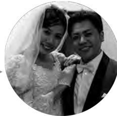
ジョン・ターナー