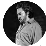
リチャード・マクベイン