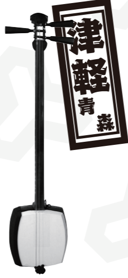
津軽三味線 犬 (いぬ)