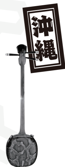
沖縄三線 蛇 (へび)

三味線の歴史は、15世紀頃に中国の弦楽器三弦(サンチェン)が琉球(現在の沖縄)に伝わり発展した三線という楽器にたどることができます。現在、私たちが知っている三味線はこの三線を改良した楽器といわれています。琉球の三線は、交易船「北前船」が全国各地をまわるうちに三味線となり、青森の津軽地方ではじめて津軽三味線となりました。同じ三本の弦を用いた楽器ですが、いろんな土地で楽器を作ったために使われる素材も改良されてきました。(沖縄は、蛇の皮。堺は、猫の皮。津軽では犬の皮を使用。)素材が変われば音色も変わる?! 津軽三味線はどんな音をかなでるのでしょうか?!