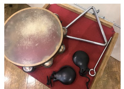
タンブリン・トライアングル・カスターネット