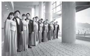
▲コロナが収まったらびわ湖ホール にもぜひお越しください！

しがけんりつげいじゆつだいがくそつぎょう びわ湖ホール専属のオペラ歌手。びわ湖ホ ールで行われるオペラや演奏会だけでなく、滋賀県内の小学生を 対象としたオーケストラのコンサート「音楽会へ出かけよう！」 や学校に出かけていく「学校巡回公演」など音楽の普及活動も 積極的に行っています。