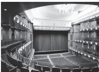
▲主にオペラを上演する びわ湖ホール大ホール