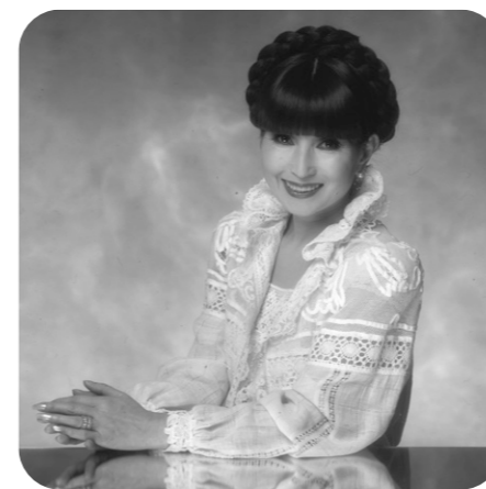
しゃかいふくしほうじん ききん 社会福祉法人 トット基金 理事 黒柳徹子

じぜん こども じつえんしどうまた かんしょうしどう おこな じつえん 事前のワークショップでは、子供たちに実演指導又は鑑賞指導を行います。また、実演では、できる だけ子供たちにも参加してもらいます。