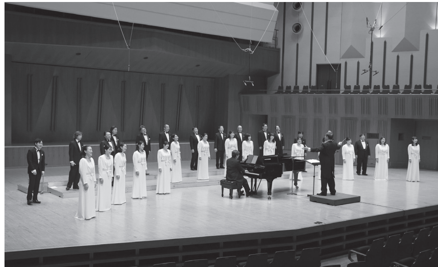
コン・コン・コンサート2023（6月4日 東京芸術劇場）