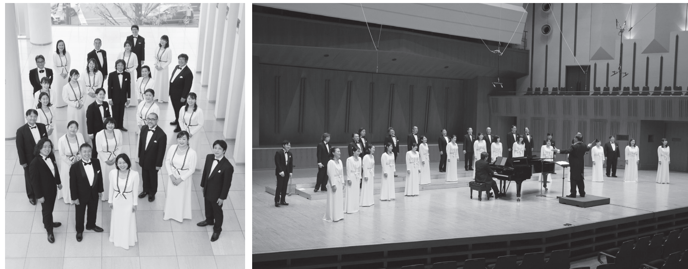
コン・コン・コンサート2023（6月4日 東京芸術劇場）

文化庁芸術祭大賞・優秀賞など国内の主な音楽賞を数多く受賞したほか、海外でも大変評価が高く、昭和54年（1979年）には、国際児童年を記念してアセアン5ヶ国で公演し、また、昭和62年（1987年）には、文化庁派遣「日米舞台芸術交流」の洋楽部門の日本代表として、アメリカ8都市で公演を行いました。さらに平成9年（1997年）には、ユネスコ世界合唱連合創立15周年記念フェスティバルに招待され、スウェーデン、ベルギーにおいて演奏、その後も平成12年（2000年）のエストニア、フィンランド公演、平成14年（2002年）のカナダ公演、平成18年（2006年）には、創立50周年を記念し、ラトヴィア、エストニア公演を開催し、多くの国の人々にも感銘を与えました。平成19年（2007年）、第38回サントリー音楽賞、第25回中島健蔵音楽賞を受賞し、平成22年（2010年）に再びフィンランド公演、平成29年（2017年）にはロシア公演、2019年2～3月にはフランスとモナコで公演を行い、絶賛を博しました。