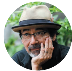
とくべつこうし 特別講師プロフィール す わ のぶひろ えい が かん とく 諏訪 敦彦(映画監督)

えい が かん とく だいがくきょうじゅ どうきょうけいじつつだい がく 映画監督、大学教授(東京藝術大学)。1997 年に公開された『2/デュオ』で長編映画監督 デビューの後、1999年公開の監督作品『M/OTHER』で、第52回カ ャヌ国際映画祭の国際批評家連盟賞を審査員全員一致で受賞。 2005年には、全てフランス人キャスト・スタッフによる『不完全なふた り』(日仏合作)がロカルノ国際映画祭において審査員特別賞と国際 芸術映画評論連盟賞を受賞。その後もフランスを活動拠点とし、オム ニバス映画『パリ・ジュテーム』(2006年)への監督参加、フランス人 俳優との共同監督による『ユキとニナ』(2009年)がカンヌ国際映画 祭において高い評価を受ける。2018年、8年ぶりの監督作品『ライオ ンは今夜死ぬ』(2017年)をフランスで撮影。久しぶりに日本で撮影 された『風の電話』(2020年)が第70回ベルリン国際映画祭国際審 査員特別賞を受賞。一般社団法人こども映画教室の専務理事を務 める。