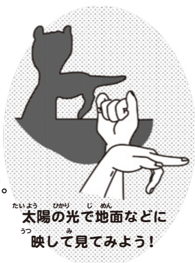
太陽の光で地面などに映して見てみよう!