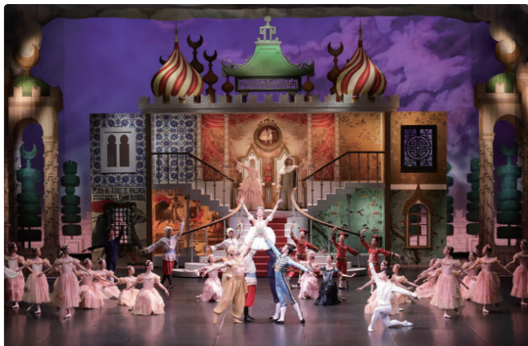
「くるみ割り人形」より