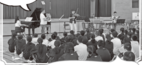
ワークショップ、オープニングの様子。 少ない人数で迫力ある演奏に釘付け!