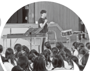
打楽器奏者は色々な楽器を演奏します。ワーク ショップでは音楽室の 楽器を借用しました!