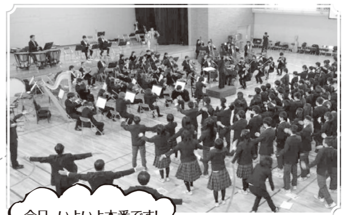
今日、いよいよ本番です!