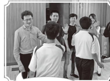
また、本公演で会おうね! 歌の練習頑張ってるね!