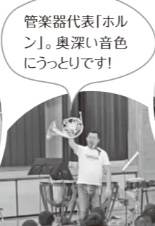
管楽器代表「ホルン」。 奥深い音色にうっとりです!