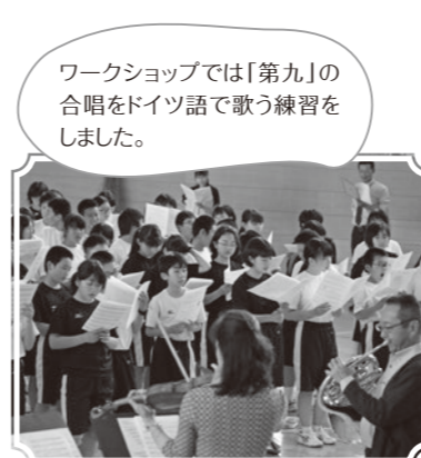
ワークショップでは「第九」の 合唱をドイツ語で歌う練習を しました。