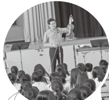
弦楽器代表「ヴァイオリン」。 音の出る仕組みを学びます。