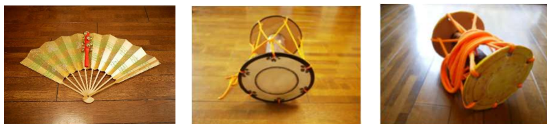
図5 図6 図7 扇と鈴、小鼓レプリカ、大鼓レプリカ ワークショップ後、扇と鈴を2セットと、当方が空き缶と段ボール紙で作った、本物そっくりの小鼓と大鼓のレプリカを各3丁ずつ使い練習して頂きます。共演1組分をお渡しします。