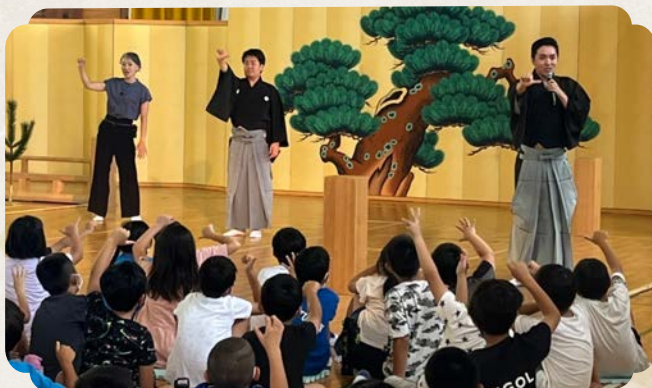
手話狂言をみんなで演じてみよう

手話狂言「附子」をご覧になったところで、事前ワークショップで習った手話の確認をします。 そして手話狂言がどのような稽古によって成り立っているのかを説明し、日本ろう者劇団の俳優 と、狂言師との二人三脚で演じる様子を舞台上で実演します。 鑑賞の生徒には手話狂言を実際に演じてもらうことで、自己の表現力を高めるほか、Q&A コーナー では出演者に積極的に質問をすることによって、コミュニケーション能力の向上を目指します。