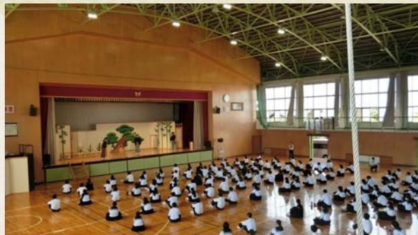
ステージ上設置イメージ (鑑賞者数多数の場合に選択いただけます)