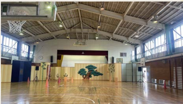
フロア上設置イメージ (基本的な設置形態です)

日本ろう者劇団の俳優と和泉流狂言師との共同作業による、「聞こえる人も聞こえない人も」同じように楽しめる手話狂言「附子」の鑑賞から、古典芸能の魅力学び、手話表現によるコミュニケーション能力向上をめざします。