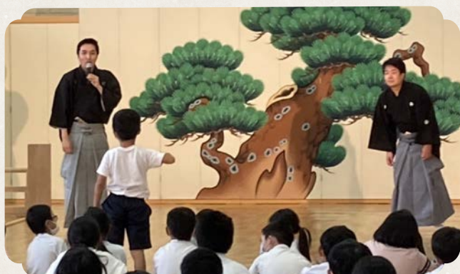
みんなの前で覚えた手話を発表します

最後に狂言の一場面を皆さんに演じてもらいます。 二つのグループに分かれて、狂言のセリフの掛け合いを、 手話で演じてみましょう。