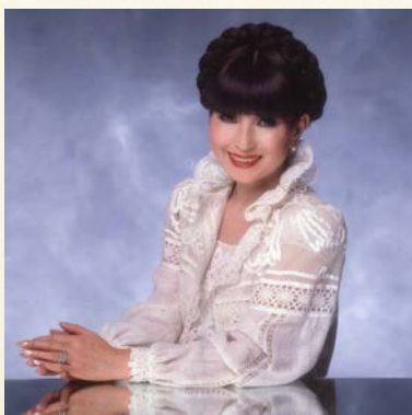
社会福祉法人 トット基金 理事長 黒柳徹子

日本ろう者劇団のレパトリーの中で、最も力を入れているのが手話狂言です。なにもかも手探りの「世界ろう者演劇祭典」（1983年）に参加したイタリアのパレルモが、はるか昔のことにように思えます。あれから、演目も少しずつ増え、日本各地、世界各国のお客様に喜んでいただいています。「狂言って、こんなに面白いって知らなかった！」見終わった後、こうおっしゃるお客様がたくさんいらっしゃるのも嬉しいことです。とにかく楽しんでいただけることは絶対です。ぜひ、ご覧いただきたいと思います。そして、よろしくお願ひします。